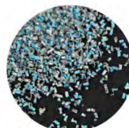
光碟粉碎尺寸: 1.6 x 4mm